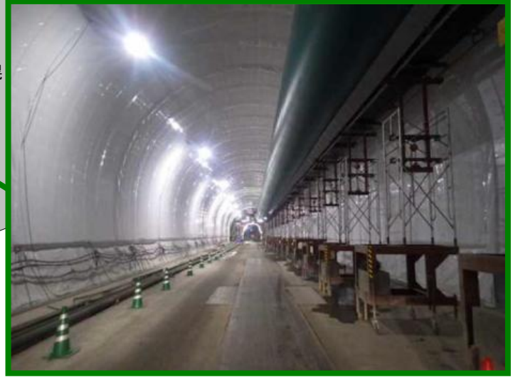
立岩トンネル（北海道 八雲町）