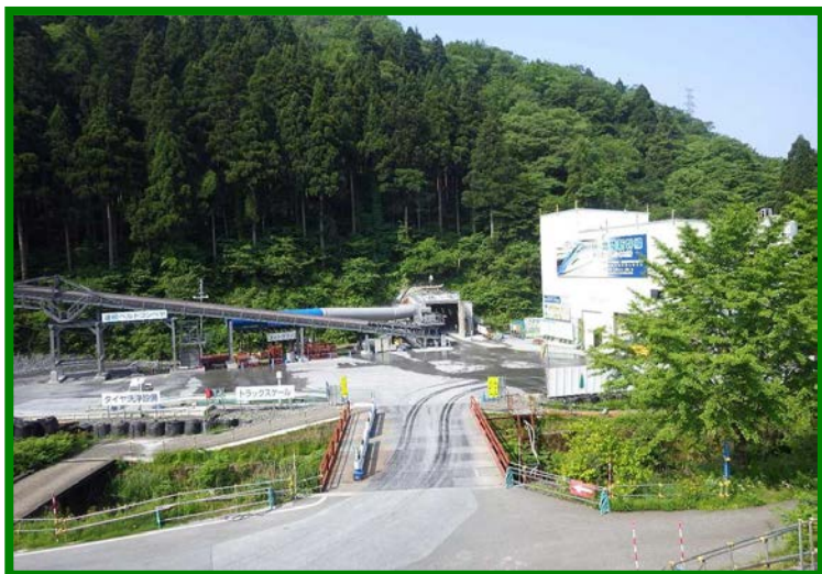
新北陸トンネル（福井県 南越前町）