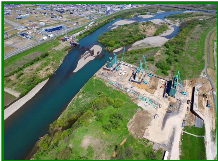
九頭竜川橋りょう（福井県 福井市）