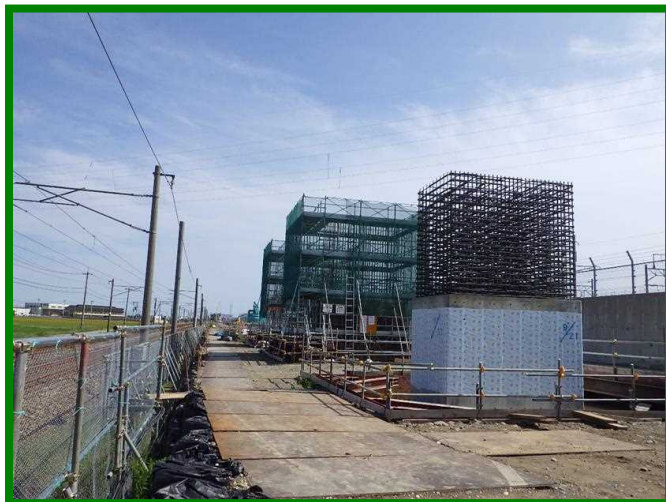
白山宮保高架橋（石川県 白山市）