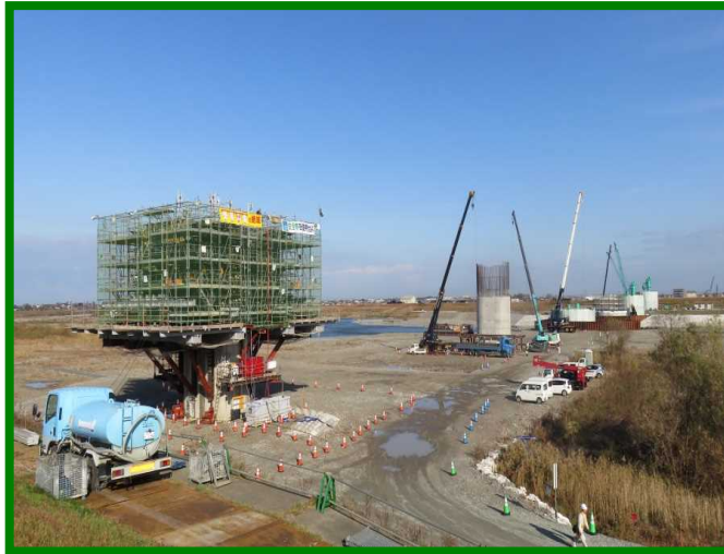
手取川橋りょう（石川県 川北町）