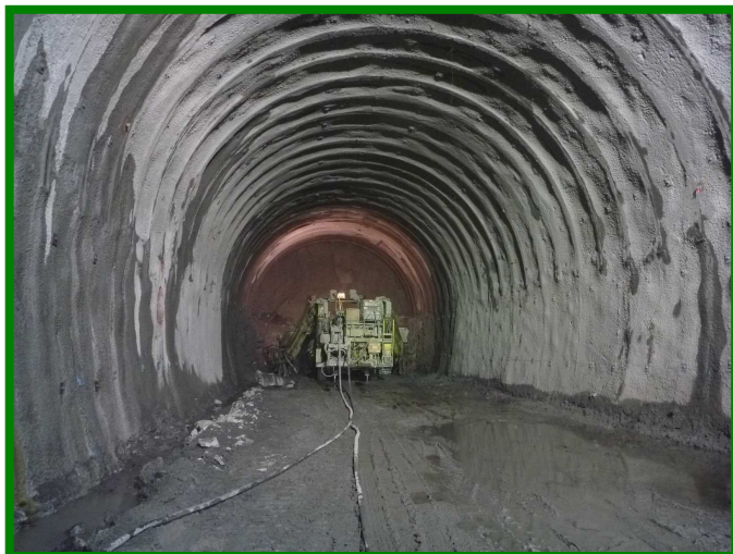
新北陸トンネル（福井県 南越前町）