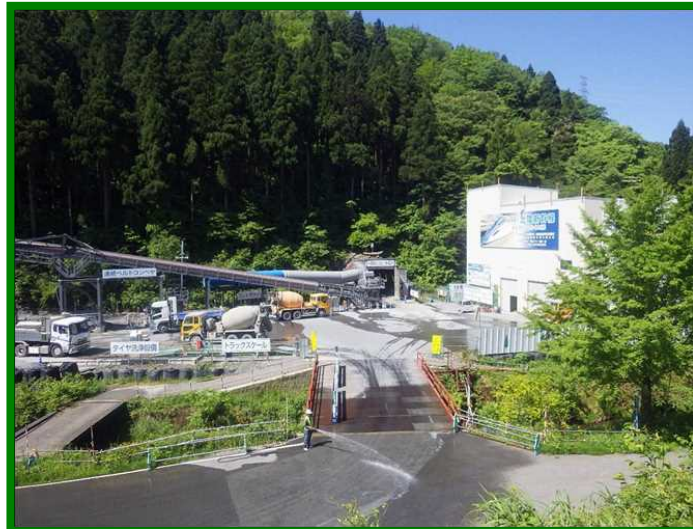
新北陸トンネル（福井県 南越前町）