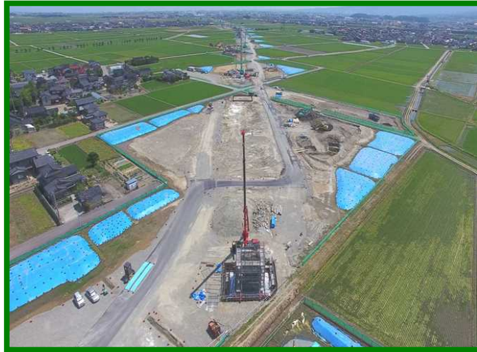
能美西任田高架橋（石川県 能美市）