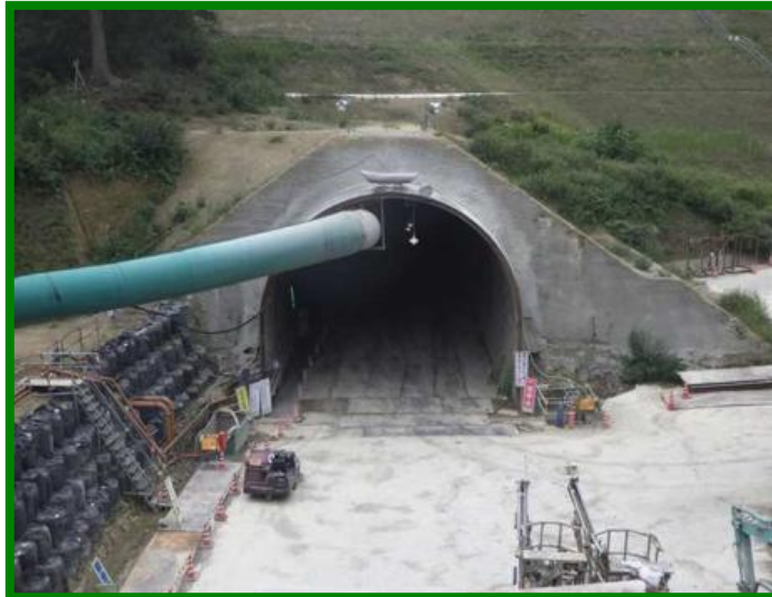
加賀トンネル（石川県 加賀市）