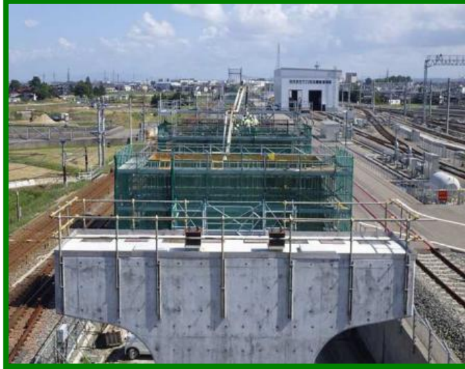
白山宮保高架橋（石川県 白山市）