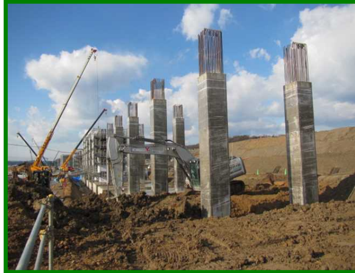
加賀温泉駅高架橋（石川県 加賀市）