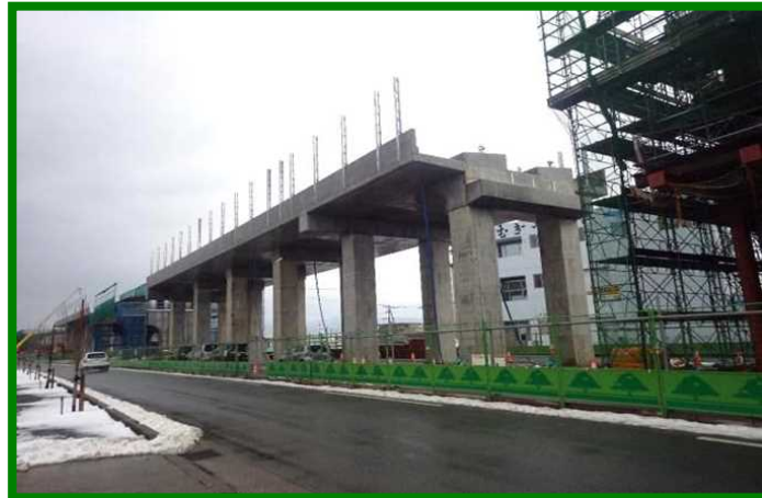
福井高柳高架橋（福井県 福井市）