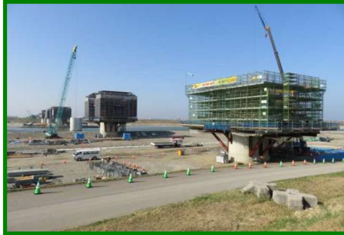
手取川橋りょう（石川県 川北町）