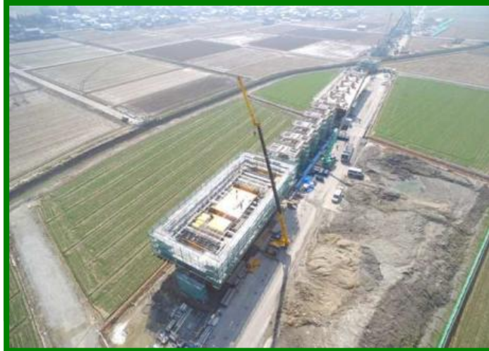
あわら金津高架橋（福井県 あわら市）