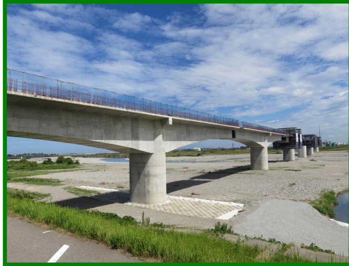
手取川橋りょう（石川県 川北町）