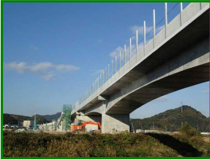
嬉野温泉駅高架橋他工区 (佐賀県 嬉野市)