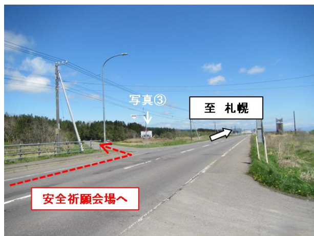
写真①: 函館方面からの交差点