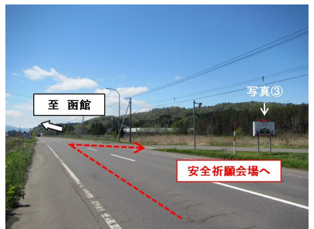
写真②: 札幌方面からの交差点