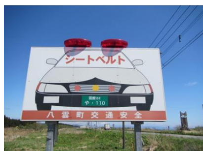
写真③: パトカー型看板