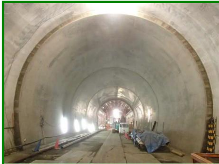
新北陸トンネル（福井県 敦賀市）