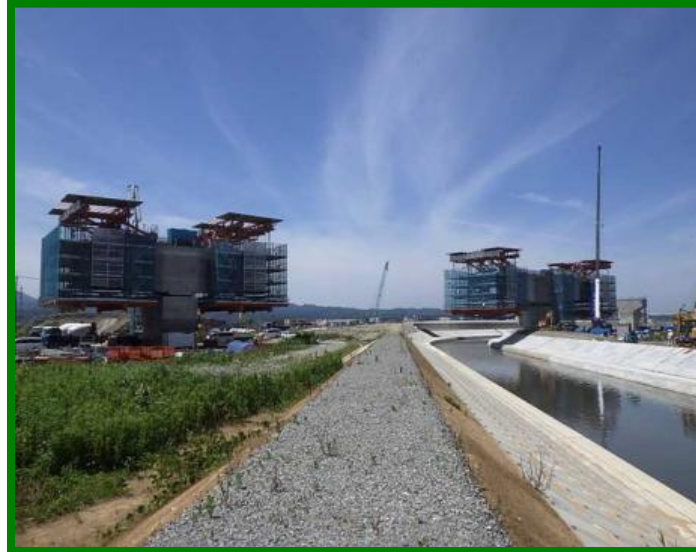
八日市川橋りょう（石川県 加賀市）