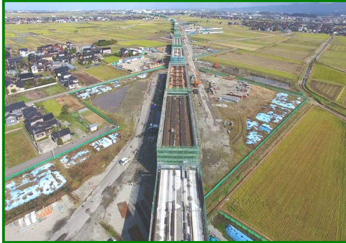
能美西任田高架橋（石川県 能美市）