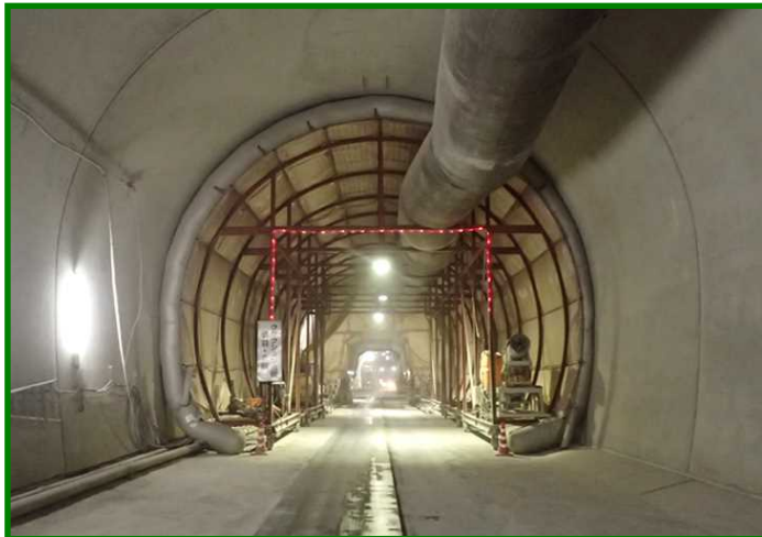
第2福井トンネル（福井県 福井市）