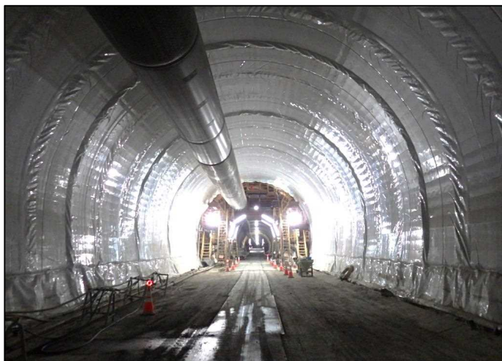
加賀トンネル（石川県 加賀市）