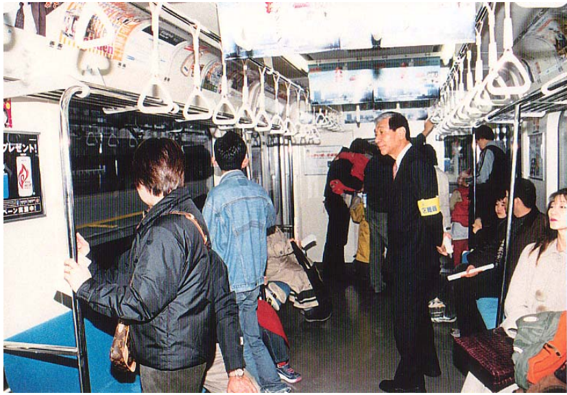
写真 12-5-1 一般試乗会