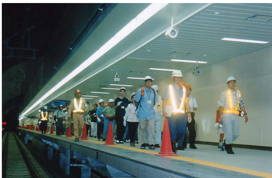
写真 12-6-2 トンネルウォーク