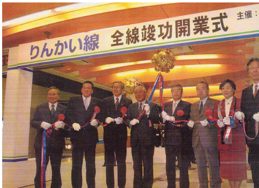
写真 12-2-1 全線竣工開業式

大井町発 (11:35) …大崎着 (11:38) 大崎発 (11:45) …大井町着 (11:48)