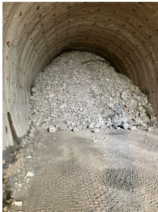
トンネル坑内の状況 (令和8年4月6日(月) 19時45分頃撮影) 新函館北斗方から札幌方を撮影