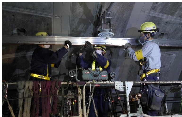
【電車線工事の様子】