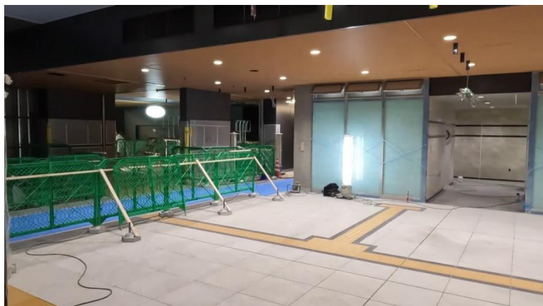
【新横浜駅コンコース】