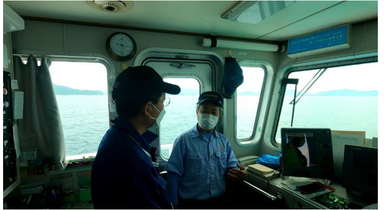
【船内でのヒアリング】