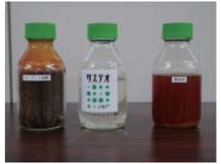
左からユーグレナから抽出した油脂、「サステオ」、廃食油。ユーグレナ社では、ユーグレナ油脂や廃食油を原料として、次世代バイオディーゼル燃料を製造しています

「オ」は、これまでのバイオディーゼル燃料とは異なり、石油由来の通常の軽油と同等の分子構造・性質を有する次世代バイオディーゼル燃料です。