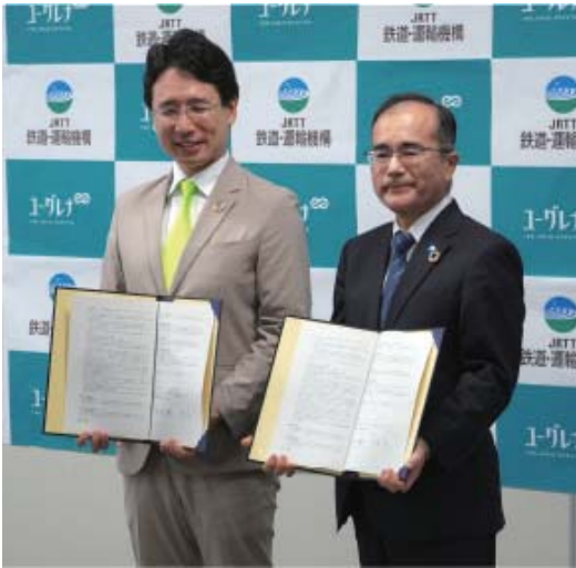
基本合意書を締結した株式会社ユーグレナ出雲社長（左）、当機構河内理事長（右）

今般、当機構とユーグレナ社は、持続可能な開発目標（SDGs）の理念に基づき、温室効果ガス排出量の一層の削減を進めるため