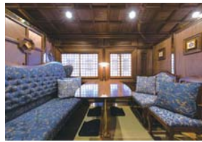
個室タイプの1号車

街に生き、鉄道の未来に生きる西九州新幹線の長崎駅。2022（令和4）年秋頃のデビューが楽しみです。