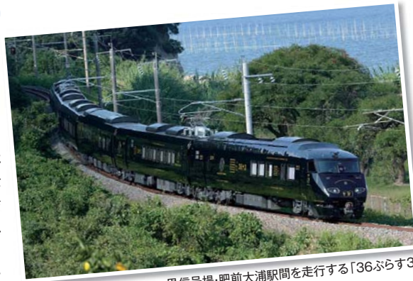
里信号場・肥前大浦駅間を走行する「36ぶらす3」

36ぶらす3は、JR九州在来線特急の主力車両である787系電車を改造したD&S（デザイン&ストーリー）列車。コンセプトは「九州のすべてが、ぎゅーっと詰まった“走る九州”といえる列車」。5日間かけて九州7県を反時計回りに巡るコース設定となっている。