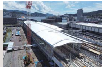
建設中の長崎駅の外観（撮影：令和3年7月）