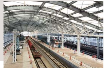
建設中の長崎駅のホーム（撮影：令和3年7月）