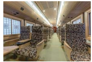
座席タイプの6号車