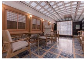
イベント等に利用される4号車