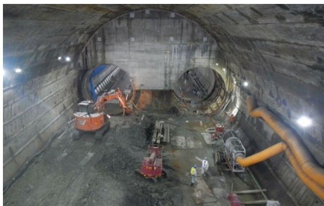
【新綱島駅非開削部工事】