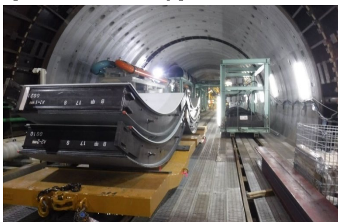
【シールドトンネル工事】