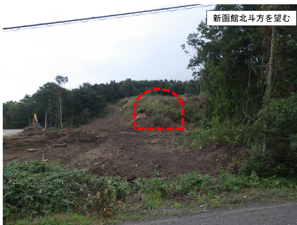
【現在の坑口の写真】

なお、安全祈願は、新型コロナウイルス感染症への影響を考慮し、最小限の出席者で実施することといたしますので、併せてお知らせします。