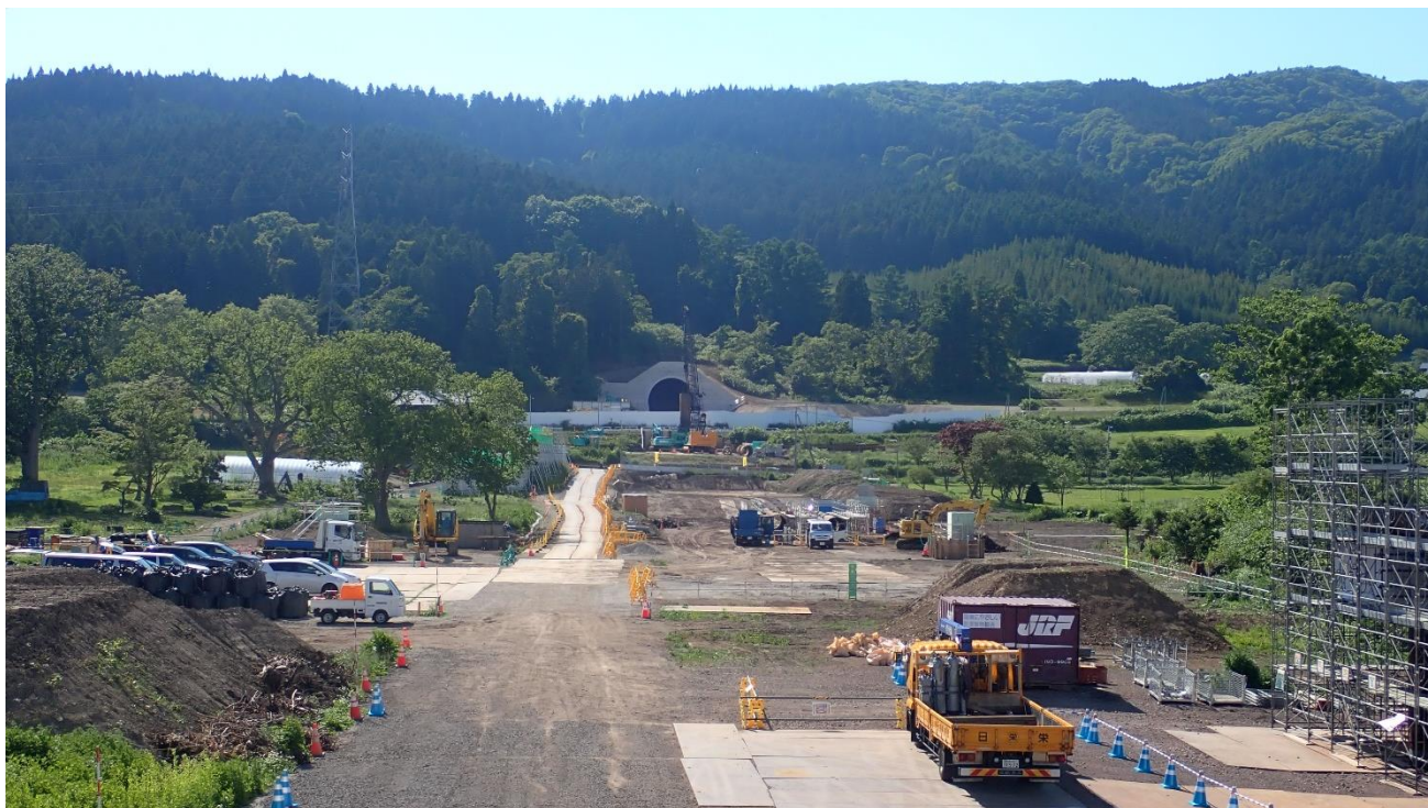
【現在の工区内の写真】

北海道新幹線（新函館北斗・札幌間）の市渡高架橋他工区（延長 461m）は、関係者の皆様のご協力を賜りながら、工事を進めております。現在、本格的な工事着手に向けた準備工を行っており、工事開始は7月5日（火）を予定しておりますのでお知らせします。工事は環境に配慮しながら、安全に留意して進めてまいります。