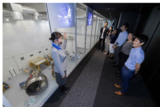
ANA Blue Base 見学の様子