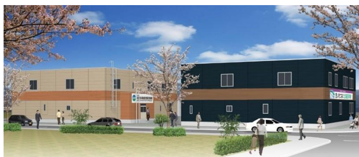
道南拠点オフィスイメージ

<本件に関するお問合せ先> 北海道新幹線建設局 総務部 広報・渉外課 TEL 011-231-3456 Mail : hokkaido-koho@jrtt.go.jp