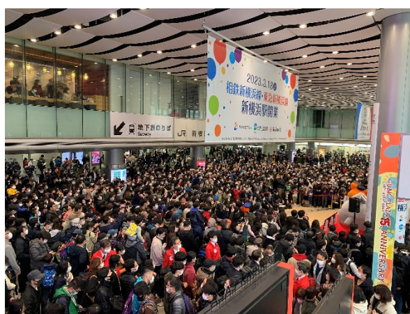
2023年3月18日開業日の新横浜駅の様子