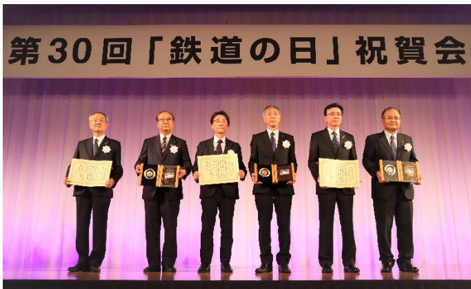
日本鉄道賞「大賞」受賞者一同 (左から 鉄道・運輸機構、相模鉄道株、東急電鉄株)