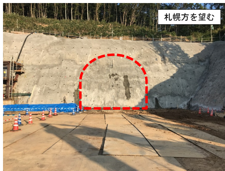
【現在の坑口の写真】

なお、安全祈願は、新型コロナウイルス感染症への影響を考慮し、最小限の出席者で実施することといたしますので、併せてお知らせします。