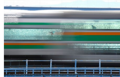
第26回グランプリ作品 『ウィンドウの中のウィンドサーフィン』

受賞作品 ： グランプリ（国土交通大臣賞） 1点 四季賞 春賞 （ 四季賞の中から、 鉄道の日実行委員会会長賞 2点 国土交通省鉄道局長賞 1点 鉄道・運輸機構理事長賞 1点 を選出 ） 4点 夏賞 秋賞 冬賞 シティ・トレイン・ビュー賞 1点 ジュニア賞（※18歳以下を対象） 1点 入選 数点