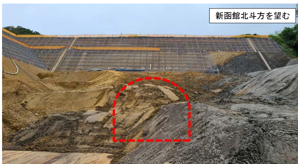
【現在の坑口の写真】

なお、安全祈願は、新型コロナウイルス感染症への影響を考慮し、最小限の出席者で実施することといたしますので、併せてお知らせします。