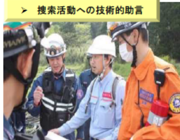
【H28.4 熊本地震】 (熊本県南阿蘇村)