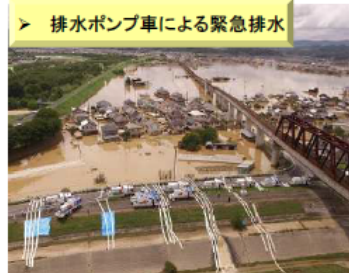
【H30.7月豪雨】 (岡山県倉敷市真備町)