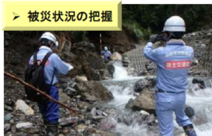
【令和2年7月豪雨】 (熊本県五木村)