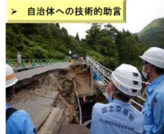
【令和4年8月の大雨】 (山形県米沢市)