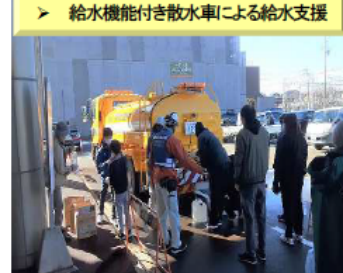
【R6.1能登半島地震】 (石川県かほく市)