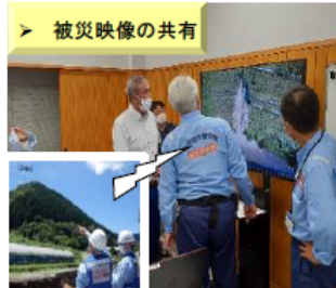
【令和3年7月1日からの大雨】 (島根県飯南町)