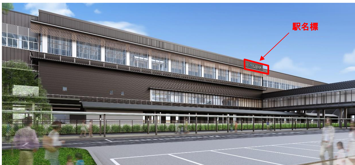
駅舎外観パース（西側）

今後、内装工事、設備工事を進めてまいりますので、工事期間中、芦原温泉駅をご利用の皆様にはご不便をおかけいたしますが、ご理解とご協力のほど、よろしくお願いいたします。