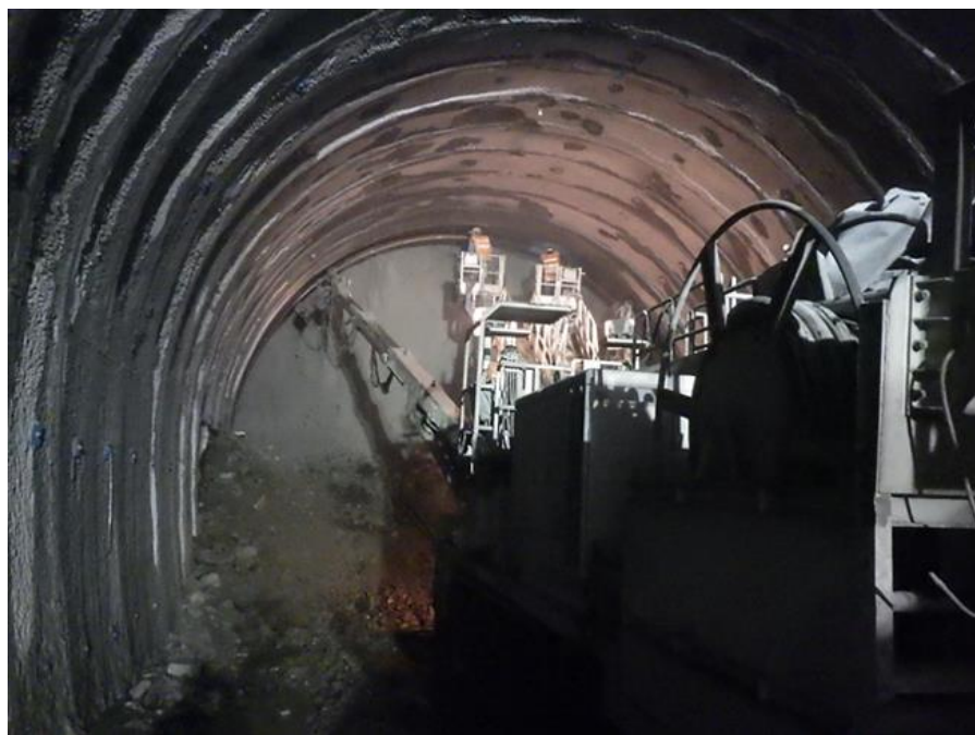
現在のトンネル坑内の様子

なお、新北陸トンネルは、北陸新幹線金沢・敦賀間で最長、営業中区間を含む北陸新幹線全線で延長が2番目のトンネルとなります。