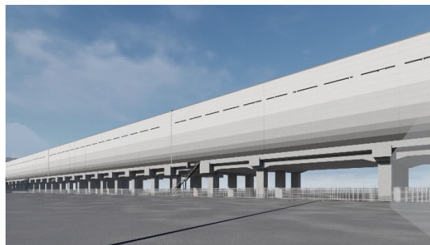
C) 東9丁目南線から南面をみる