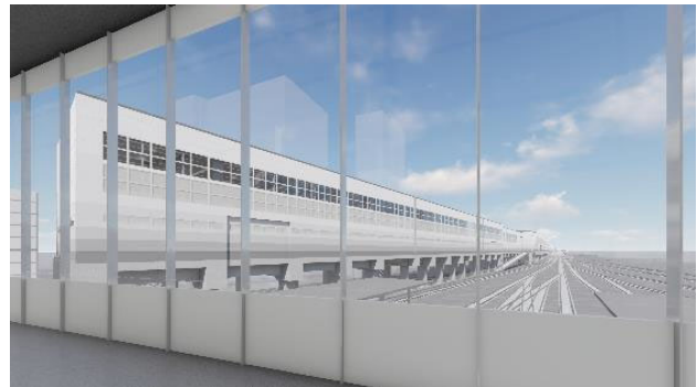
B) 苗穂駅自由通路から北面をみる