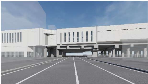
A) 東2丁目線から南面をみる