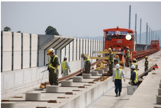
レール敷設作業（北陸新幹線（長野・金沢間）の例）