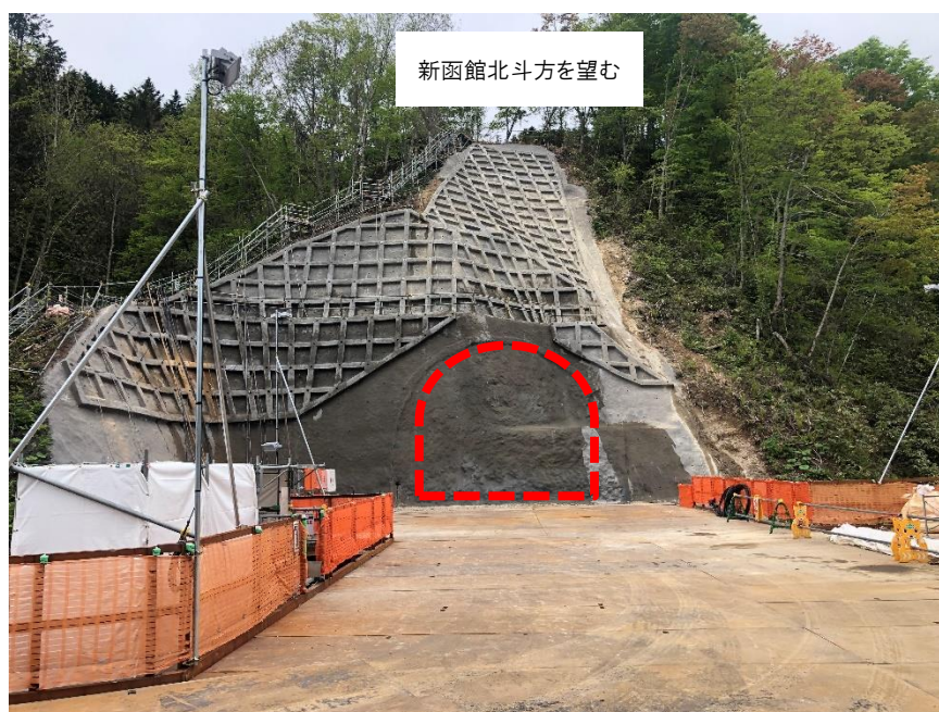
【現在の坑口の写真】

なお、新型コロナウイルス感染症への影響を考慮して、来賓を招いた安全祈願は行わないことといたしますので、併せてお知らせします。