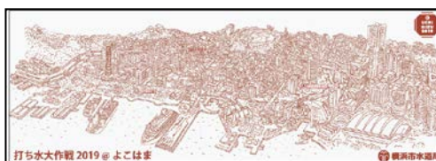
打ち水大作戦 2019@よこはま オリジナル手ぬぐい

ご参加いただいた方には、オリジナル手ぬぐい、はまっ子どうし The Water(ポルドウォーター)を差し上げます。