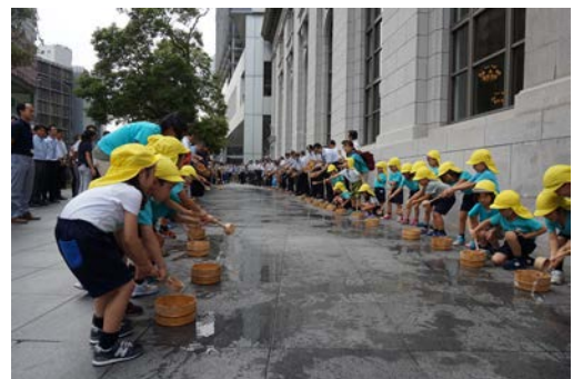
【昨年の打ち水の様子】

※取材をご希望の方は、8月7日(水)までに別添申込書に必要事項をご記入の上、FAXにてご連絡ください。