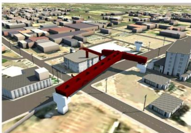
(参考)御宮架道橋・幸町架道橋 架設(運搬)作業の比較