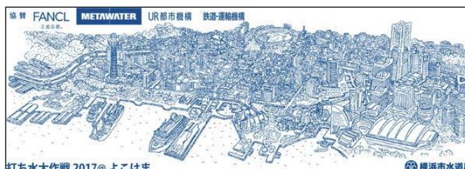
打ち水大作戦 2017@よこはま オリジナル手ぬぐい

ご参加いただいた方に開催場所の入ったオリジナル手ぬぐいの他、お子様には 色鉛筆、メモ帳など両機構のグッズもプレゼント。