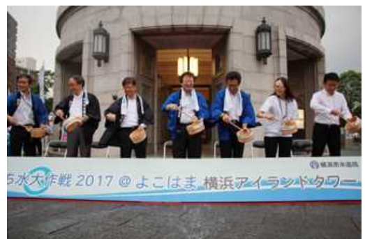
【昨年の打ち水の様子】

※取材をご希望の方は、8月7日(火)までに別添申込書に必要事項をご記入の上、FAXにてご連絡ください。