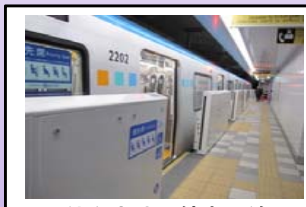
仙台市地下鉄東西線