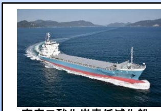
高度二酸化炭素低減化船