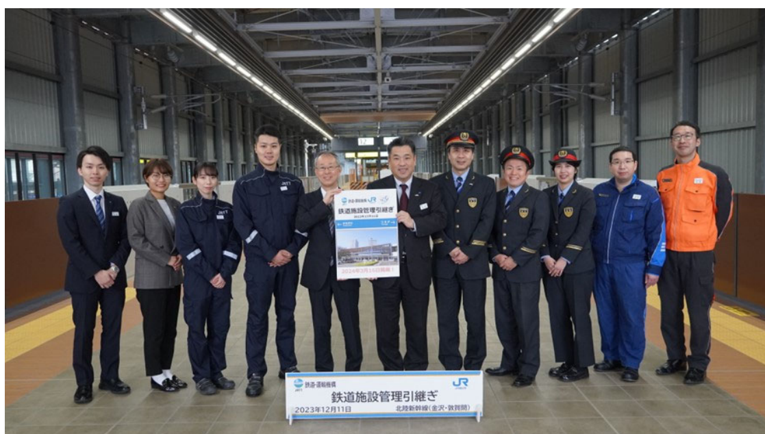
管理引継ぎの様子

引継ぎを受け、来年3月16日の開業に向けて、国土交通省による完成検査及びJR西日本による訓練運転が実施される予定です。