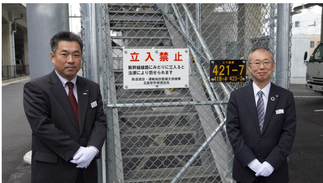
立入り禁止標の管理者の変更の様子