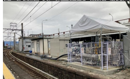
伊豆箱根鉄道駿豆線における営業線運用検証

超電導ケーブルを鉄道システムに適用する超電導送電システムは、ゼロ抵抗送電による安定輸送への寄与、変電所の集約化、省エネルギー化などといった効果が期待されます。このシステムの実用化と普及に向け、営業線における運用検証を実施しています。